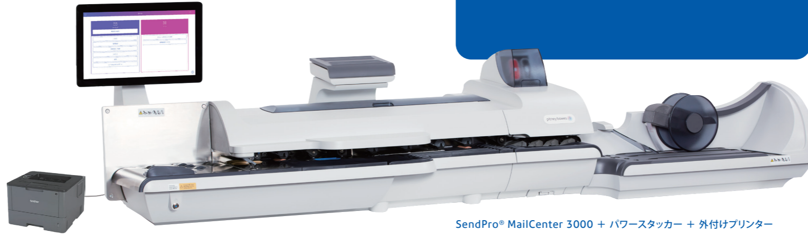
SendPro® MailCenter 3000 + パワースタッカー + 外付けプリンター

SendPro® MailCenter 3000は、重さやサイズの違う大量の郵便物の処理が可能です。またお客様のニーズに応える様々なオプションを用意しております。