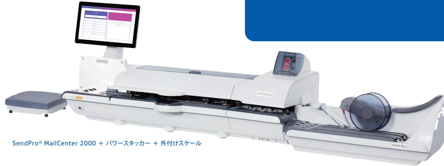
SendPro® MailCenter 2000 + パワースタッカー + 外付けスケール

SendPro® MailCenter 2000は、重さやサイズの違う大量の郵便物の処理が可能です。またお客様のニーズに応える様々なオプションを用意しております。