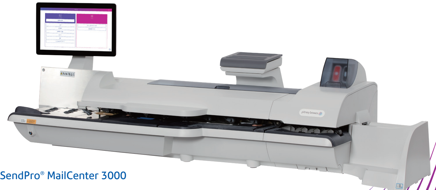
SendPro® MailCenter 3000