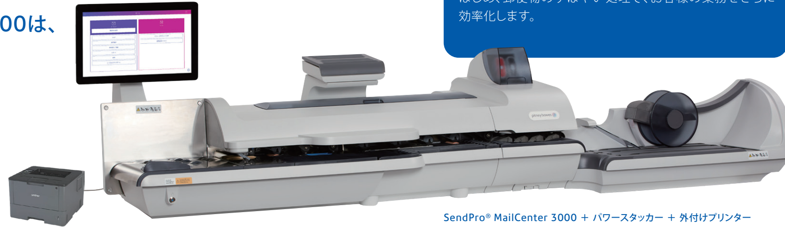
SendPro® MailCenter 3000 + パワースタッカー + 外付けプリンター

SendPro® MailCenter 2000 / 3000は、 重さやサイズの違う大量の 郵便物の処理が可能です。 またお客様のニーズに応える様々な オプションを用意しております。