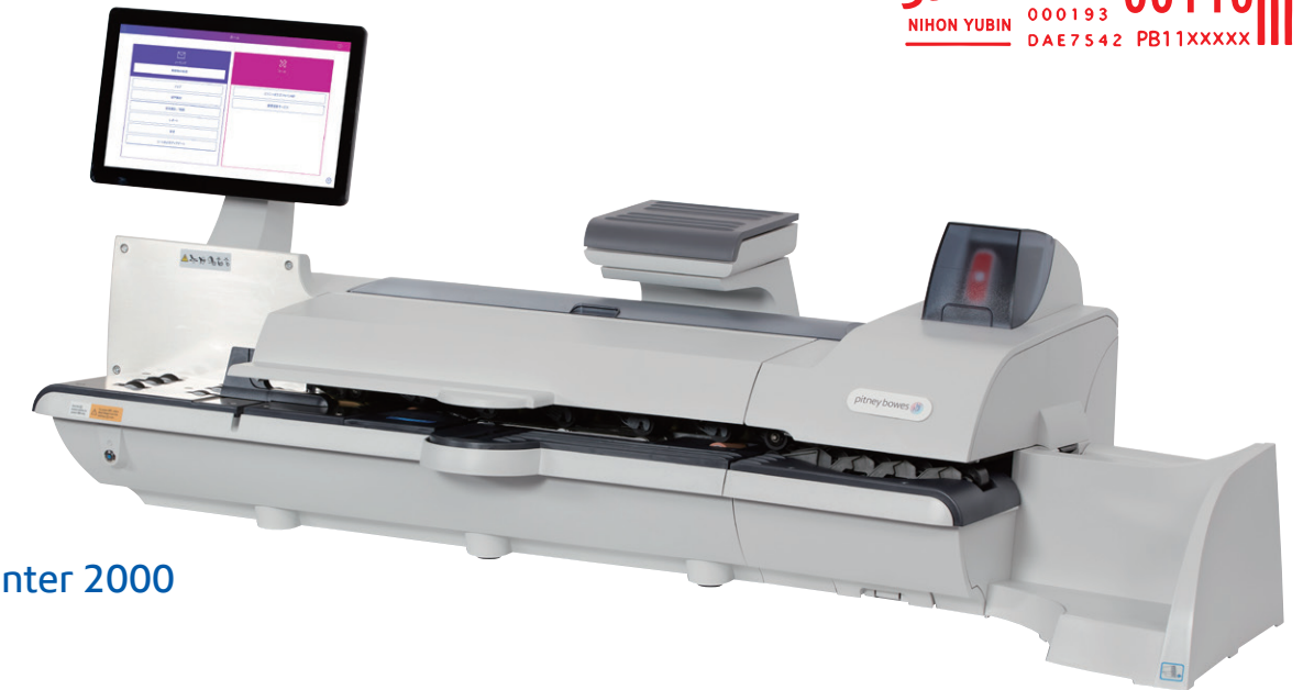
SendPro® MailCenter 2000